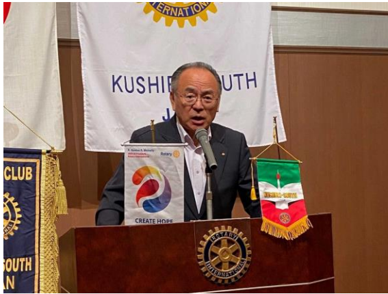
福井パストガバナー補佐の挨拶