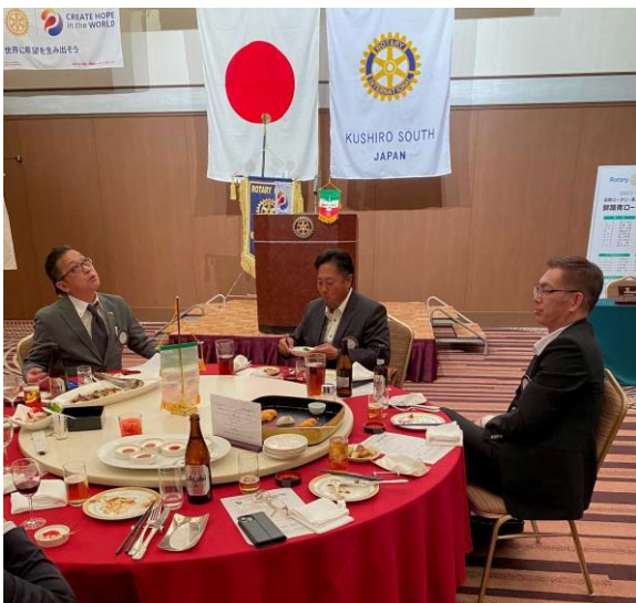
何か考え中かな小向親睦委員長