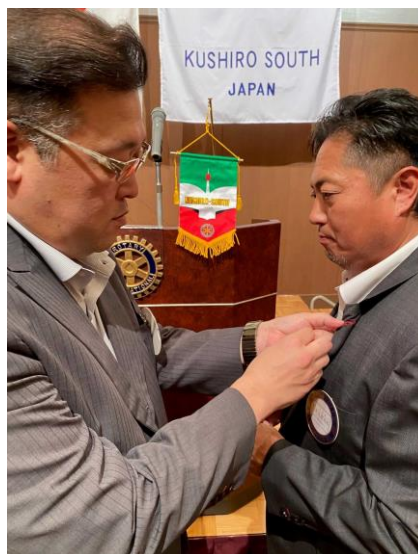
幹事新旧バッジ交換