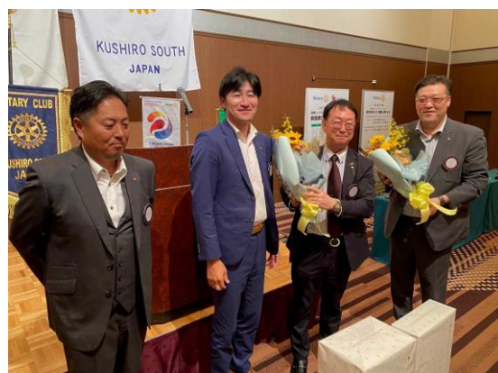
佐藤次年度会長より長江会長・幹事へ記念品花束を