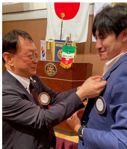
会長新旧バッジ交換