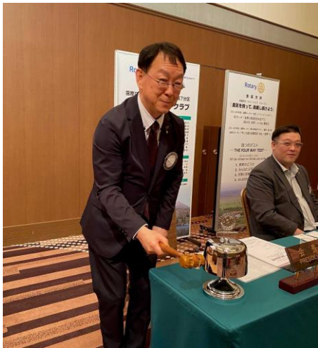
年度最後の点鐘 長江会長