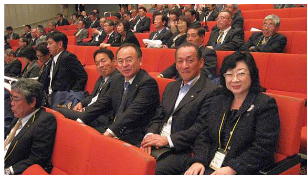
文化会館大ホールで