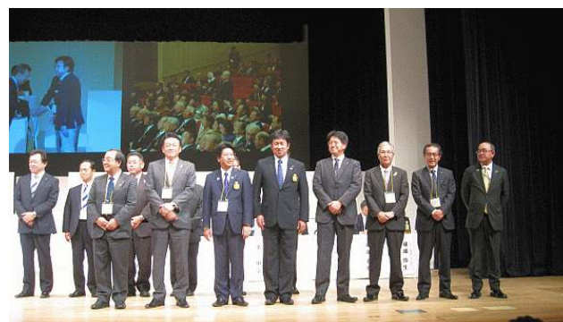
第7分区 会長・幹事 登壇紹介