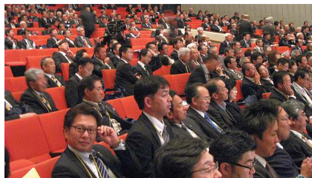
文化会館大ホールで