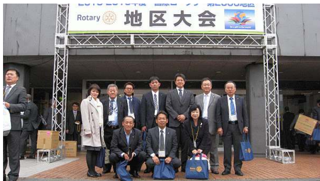
旭川市民文化会館前で

ムが進み、地区大会は幕を閉じました。 夜は「記念懇親会」に参加した後、クラブの会員で 2次会、3次会と楽しい旭川の夜を堪能致しました。