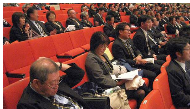
文化会館大ホールで