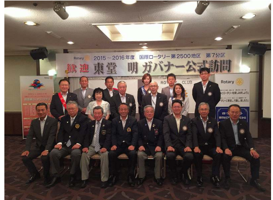
東堂ガバナー公式訪問、出席者全員で記念写真