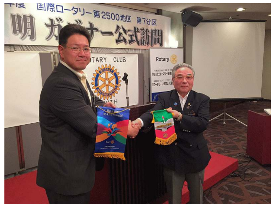
東堂ガバナー、長井会長によるバナー交換