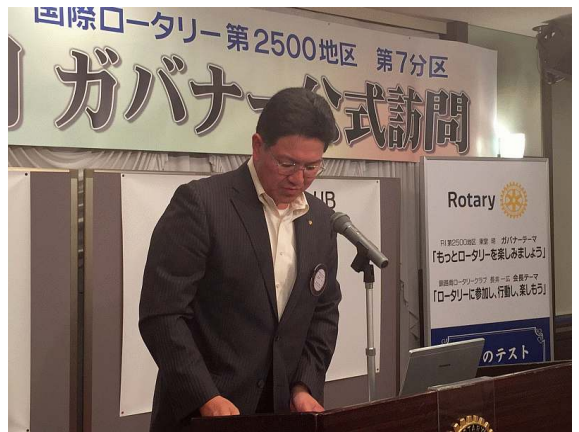
長井会長、来訪ロータリアンのご紹介並びに挨拶