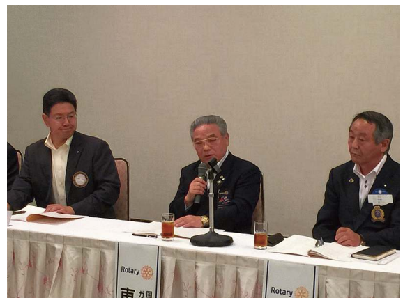
東堂ガバナーより講評・質疑応答への助言を頂きました